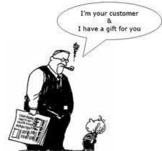
Reframing and learning from complaints